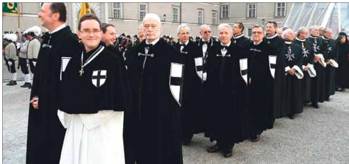
Man erkennt sie am schwarzen Kreuz auf weißem Grund. Mitglieder des Deutschen Ordens, bei der Einführung des Salzburger Erzbischofs (im Hintergrund Mitglieder des Malteserordens).

Von den Kreuzzügen bis heute: die Ideale des Ordens sind geblieben