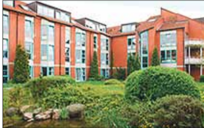
Das Altenheim St. Anna des Deutschen Ordens in Raisdorf bei Kiel. Bild rechts: Der Minnesänger Tannhäuser, dargestellt als Deutschordens-Ritter.