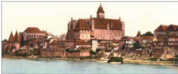
Die Marienburg östlich von Danzig, von 1309 bis 1457 Sitz der Hochmeister, ist ein Symbol für die Geschichte des Deutschen Ordens.

825 Jahren ein Orden der katholischen Kirche mit päpstlicher Anerkennung, ähnlich wie alle klassischen Orden. Der Deutsche Orden gehört in die Tradition der Ritterorden. Ein Ziel war immer die Ausbreitung, Sicherung und Verteidigung des christlichen Glaubens. Ein zweiter Schwerpunkt ist die soziale Komponente, eine Tradition, die sich von den Hospizen des Mittelalters bis zu den Einrichtungen der Suchttherapie unserer Tage durch die Jahrhunderte zieht. Ein weiterer Akzent ist das kulturelle Engagement: von den mittelalterlichen Lateinschulen bis zum heutigen Musikonservatorium. Ein besonderes Spezifikum schließlich ist der Wille, Gesellschaft im Geiste