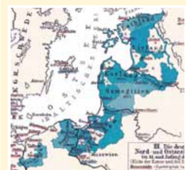
Der Deutschordensstaat in seiner größten Ausdehnung Ende des 14. Jahrhunderts